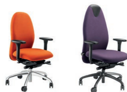
TANGO TG 23

BÜRODREHSTÜHLE / OFFICE SWIVEL CHAIRS / SIÈGES DE BUREAU