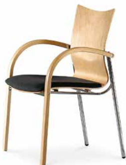
Modell 5061/A: Buche natur, Sitzpolster