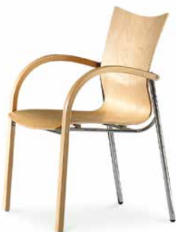
Modell 5060/A: Buche natur, ungepolstert