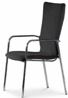
Modell 5084/A: Vollpolster