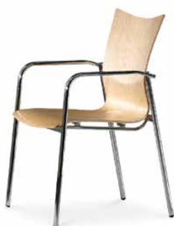
Modell 5080/A: Buche natur, ungepolstert