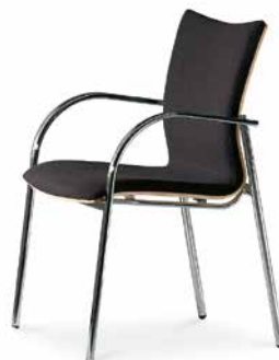
Modell 5072/A: Buche natur, Polsterdoppel