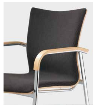
Armlehne Flachovalrohr mit Buchschichtholzaufgabe