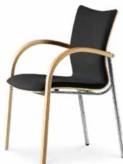
Modell 5062/A: Buche natur, Polsterdoppel