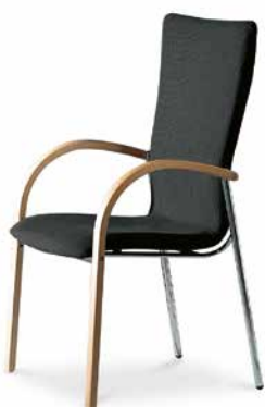
Modell 5064/A: Vollpolster