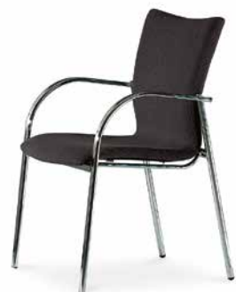
Modell 5073/A: Vollpolster