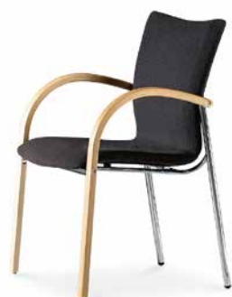
Modell 5063/A: Vollpolster