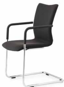
Modell 5093/A nicht stapelbar