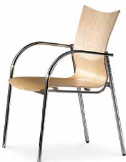
Modell 5070/A: Buche natur, ungepolstert