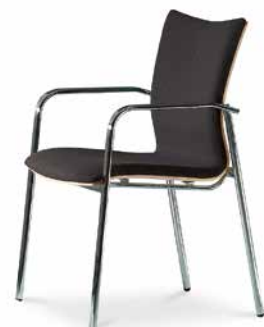
Modell 5082/A: Buche natur, Polsterdoppel