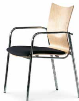
Modell 5081/A: Buche natur, Sitzpolster