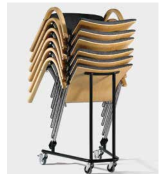
Modell 1038: Transportwagen