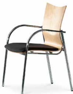
Modell 5071/A: Buche natur, Sitzpolster