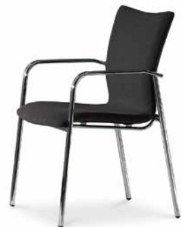
Modell 5083/A: Vollpolster