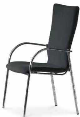
Modell 5074/A: Vollpolster