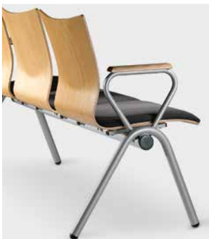
Modell 5061/A-3: Sitzbank mit Buchschichtholzarmauflage

Modell 5061: Traversenbank, zwei-, drei- oder viersitzig mit oder ohne Armlehnen, optional mit Ablageplatte lieferbar.