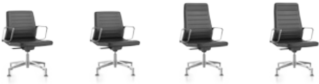
Konferenz- sessel nieder, Schale sichtbar, Sitz und Rücken gepolstert Konferenz- sessel nieder, Schale bezogen, Sitz und Rücken gepolstert Konferenz- sessel hoch, Schale sichtbar, Sitz und Rücken gepolstert Konferenz- sessel hoch, Schale bezogen, Sitz und Rücken gepolstert 1V10 1V11 1V60 1V61