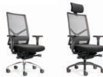
FIGO AIR 1N