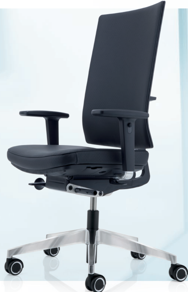
SlimLine Plus Leder