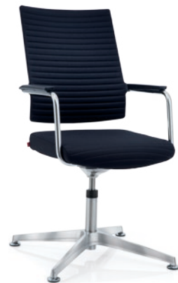
ANTEO® Konferenz Drehstuhl auf Gleitern