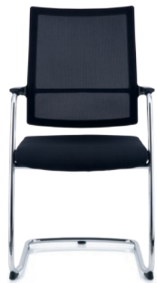
ANTEO® Konferenz Schwinger