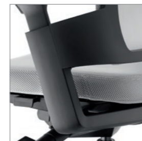
Armlehenträger Schwarz matt Aluminium