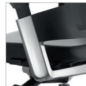
Armlehenträger Aluminium poliert