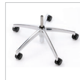
Drehkreuz Aluminium poliert