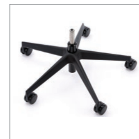
Drehkreuz Schwarz Kunststoff