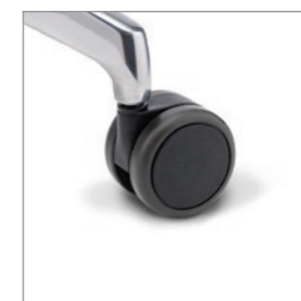
Rolle weich (für harte Böden)