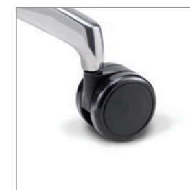
Rolle hart (für Teppich)