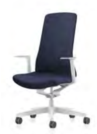
Drehstuhl, Rücken gepolstert

PURE IS3 passt perfekt in jedes Umfeld. Sein klares Design und die große Auswahl an Farben und Stoffen lassen viel Freiheit für eine individuelle Gestaltung. Die Kollektion umfasst vier Drehstuhlmodelle: Netz- und Polsterrücken, jeweils in weißem und schwarzem Design. Dabei kann aus einer Vielzahl an Materialien und Farben ausgewählt werden. Smart Spring, Stuhlsäule und die optionalen Armlehnen sind bei allen Modellen einheitlich entweder in Weiß oder Schwarz gehalten. Zur Auswahl stehen fixe T-Armlehnen oder 3D T-Armlehnen, die fixe T-Armlehne besticht durch ihr schlankes Design, die 3D T-Armlehne überzeugt zudem funktionell und ist in Höhe, Breite und Tiefe verstellbar.