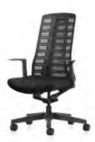
Drehstuhl, Rücken netzbespannt