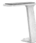
Fixe T-Armlehne, weiß

1 Farbgestaltung: Ausführung in Schwarz: alle Kunststoffteile sowie „Rückeninlay“. Ausführung in Weiß: alle Kunststoffteile sowie „Rückeninlay“ außer Rollen und Armlehenauflage (diese sind immer schwarz).