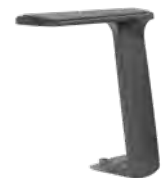
Fixe T-Armlehne, schwarz