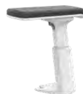
3D T-Armlehne, weiß