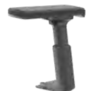
3D T-Armlehne, schwarz