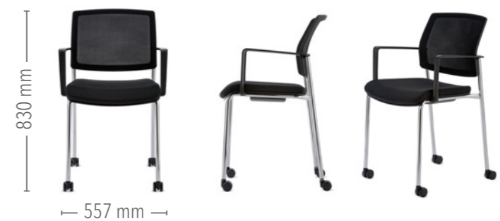
Vierfuß Konferenz mit Rollen