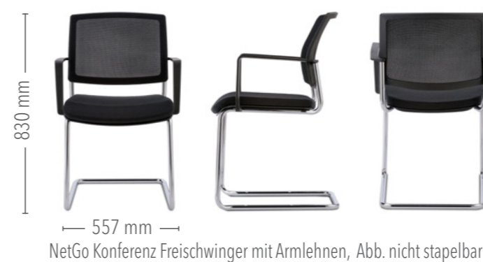
NetGo Konferenz Freischwinger mit Armlehnen, Abb. nicht stapelbar