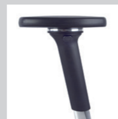
4D Multifunktionsarmlehne NPR