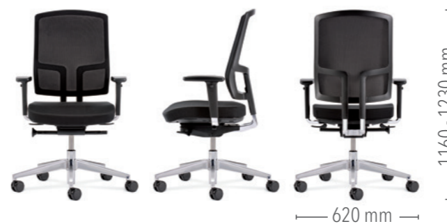
Mit Sitztiefeverstellung und Multifunktionsarmlehnen (3D) Gestell in Aluminium poliert