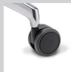
Rollen weich (für harte Böden)