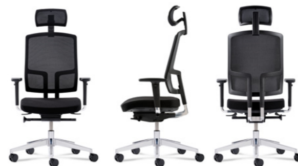
Wahlweise mit Kopfstütze erhältlich