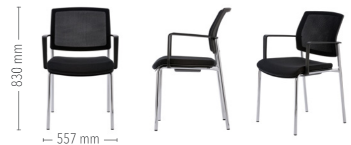
Vierfuß Konferenz, mit Armlehnen

Für den robusten Einsatz ist der Vierfuß Konferenz auch ohne Polster mit einer Kunststoff-Sitzschale erhältlich.