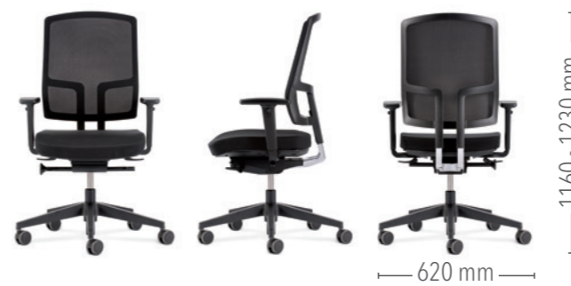
Mit Sitztiefeverstellung und Funktionsarmlehnen (2D) Gestell in Kunststoff schwarz