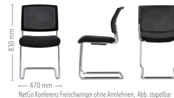
NetGo Konferenz Freischwinger ohne Armlehnen, Abb. stapelbar