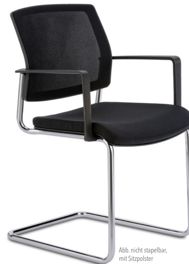
Abb. nicht stapelbar, mit Sitzpolster