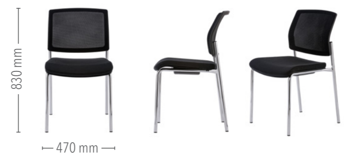
Vierfuß Konferenz ohne Armlehnen