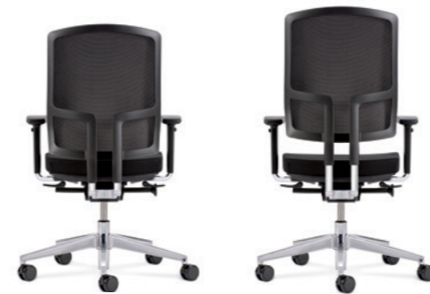
Der Verstellbereich des Netzurückens beträgt 70 mm. Rückenstab aus Aluminium poliert