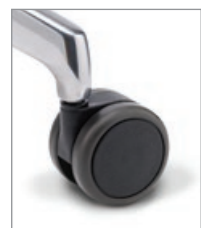
für harte Böden