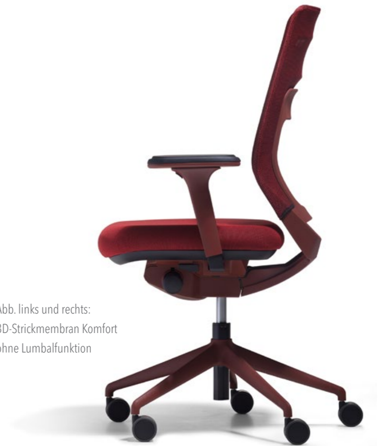
Abb. links und rechts: 3D-Strickmembran Komfort ohne Lumbalfunktion

Der fm asiento ist nicht irgendein Bürostuhl. Der fm asiento ist ein Unikat – einzigartig und unverwechselbar. Ein Stuhl mit einem fm-eigenen Look, einem modernen Farbkonzept und einem einzigartigen Materialmix. Der fm asiento ist komplett über fm entwickelt und wird mit eigenen Werkzeugen in Deutschland produziert.