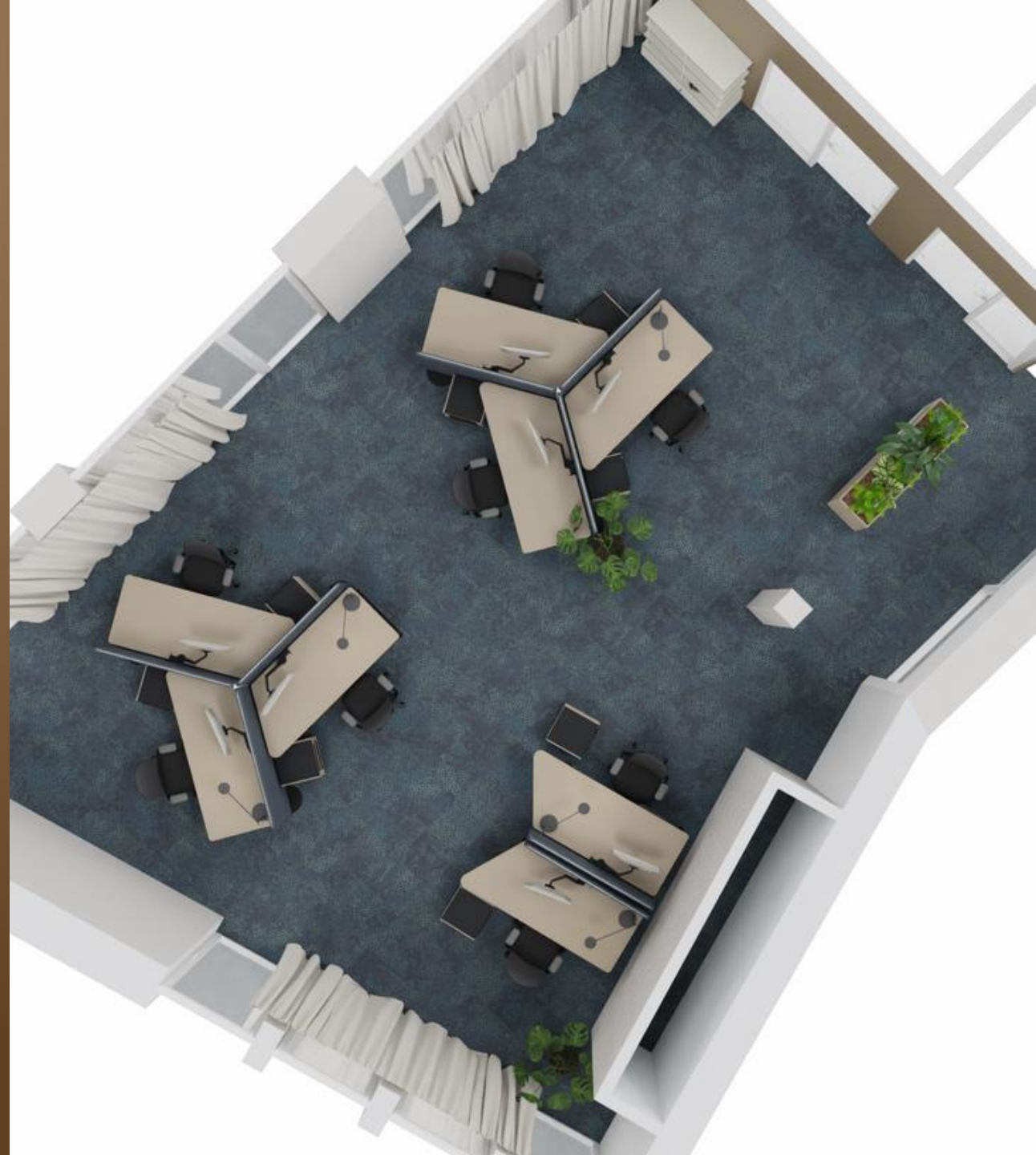
Abbildung: Tischlösung nach Kundenwunsch. Wandsystem: WINEA SONIC